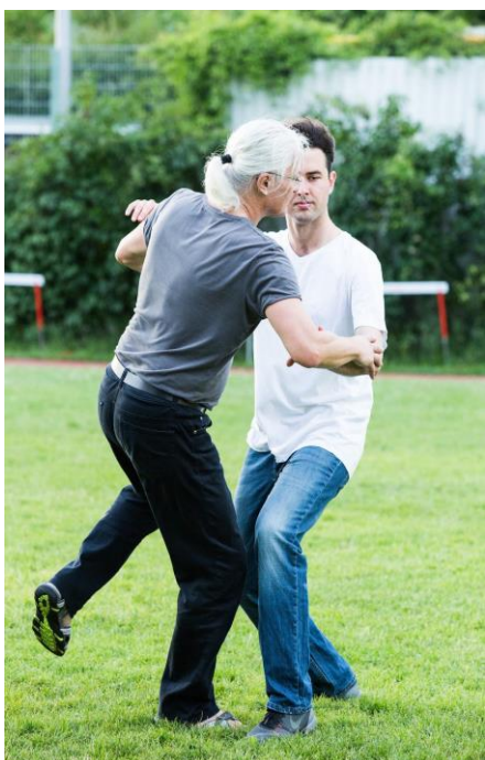
Illustration 3: Entraînement avec un partenaire de taiji : une situation d'extrême complexité qui nécessite une concentration très profonde.

Ces corrections impliquent des changements qui ne sont pas faciles à mettre en œuvre et qui nécessitent beaucoup d'efforts de la part de l'étudiant. Il y a une condition implicite : que l'étudiant voit ce qu'il fait et comprenne ce qui doit être fait. C'est seulement alors qu'il y a une chance de changer un mouvement habituel. Tant qu'il y a un écart entre ce que l'étudiant croit qu'il / elle fait et le mouvement corporel réel, il n'a pas (encore) une chance d'effectuer le mouvement correct. Le problème principal ici est que la prise de conscience, ou l'écoute, n'est pas assez profonde. Dans son état quotidien, un esprit qui est simplement tranquille et vigilant ne capte pas le retour de ses capteurs internes qui exigent un état beaucoup plus profond de l'esprit pour être perçu.