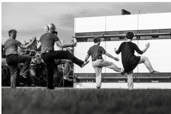
Illustration 3: S'entraîner à une forme comme une méditation en mouvement contribue à l'intégration des niveaux plus profonds de l'esprit. L'utilisation de l'intention est essentielle.

Toutes les écoles s'efforcent de travailler le raffinement, mais pas toutes le même type de raffinement. La différence n'est pas difficile à voir pour un œil bien entraîné. En ce qui concerne le changement peut-être le facteur le plus important est l'intention de changer. Souvent les gens disent qu'ils veulent changer, mais dès qu'ils se confrontent à la réalité pour prendre les premières mesures, ils reculent. Le changement menace soudainement quelque chose qu'ils ne veulent pas laisser aller, ou qui devient trop difficile. Un simple désir superficiel ne peut pas surmonter une résistance profonde, et donc aucun changement ne se produira.