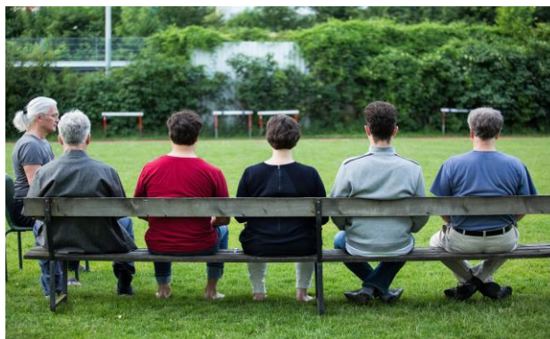
Illustration 2 : La méditation apporte une contribution importante à la formation de l'esprit dans la pratique du taiji.

Ce n'est qu'en formant l'esprit en ce sens, c'est-à-dire en exerçant l'approfondissement de l'esprit, en modulant ses différents niveaux de conscience et en pratiquant la simultanéité de l'intention et de la conscience que le dilemme qui découle des limites de la conscience quotidienne, se résout lentement. L'esprit superficiel ne peut traiter qu'une quantité très limitée d'informations sensorielles de telle sorte que le contrôle des réactions d'adaptation se déroule dans un sens – c'est-à-dire dans l'esprit des principes du taiji.